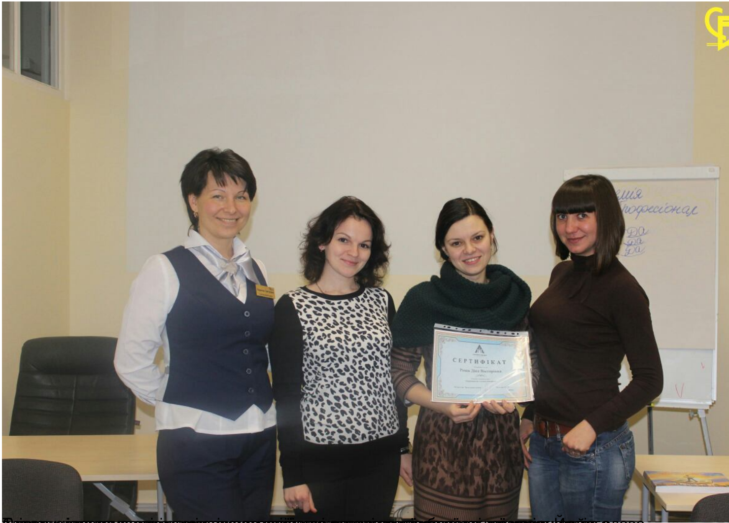
Учасники тренінгу та організаторка заходу, яка вручила сертифікат за успішне проходження курсу.